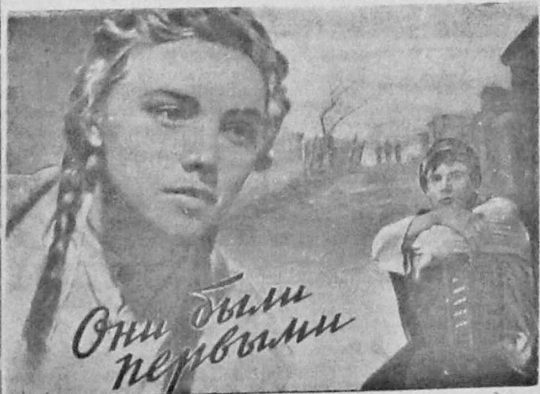
В главных ролях артисты: Кондратьев, Юматов, Алешникова, Бернес, Ульянов. Производство киностудии им. М. Горького.

выпускает на экраны кинотеатров города новый художественный фильм